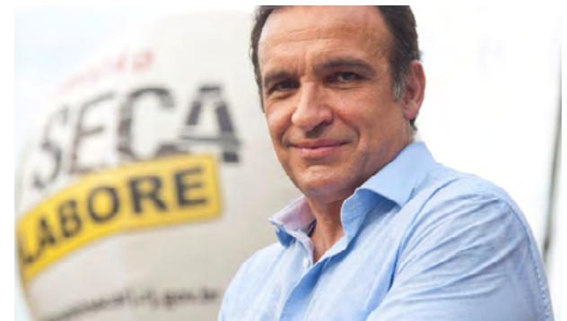
Deputado Federal, Hugo Leal

Esses dispositivos para detecção de drogas ainda aguardam regulamentação do Instituto Nacional de Metrologia e do Departamento Nacional de Trânsito. O Denatran prevê que as regras para que os drogômetros comecem a ser utilizados nas operações de trânsito devem estar em vigor até o