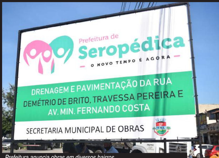
Prefeitura anuncia obras em diversos bairros