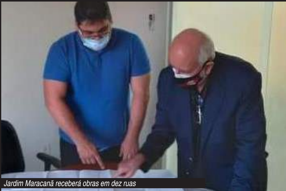
Jardim Maracanã receberá obras em dez ruas