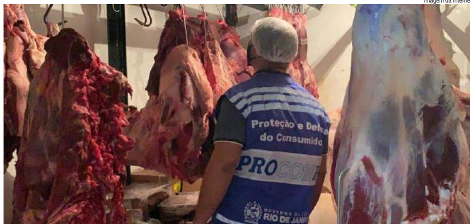
Agentes do Procon multam estabelecimentos