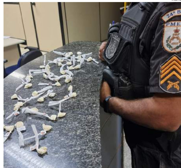
Poliçada de Seropédica está atuante