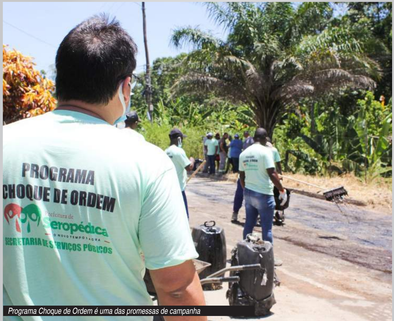
Programa Choque de Ordem é uma das promessas de campanha

deu um salto de qualidade de vida nos últimos meses, apesar da pandemia do Coronavírus. A transparência das informações e o entendimento que a administração pública deve interagir com os munícipes, com a tomada de decisões de forma impessoal, são as marcas do novo governo: “É meu dever promover a transparência na administração pública. Por isso, é importante prestar contas à população. “Estamos administrando o patrimônio público e a minha missão é fazê-lo de maneira eficiente”, disse o prefeito.