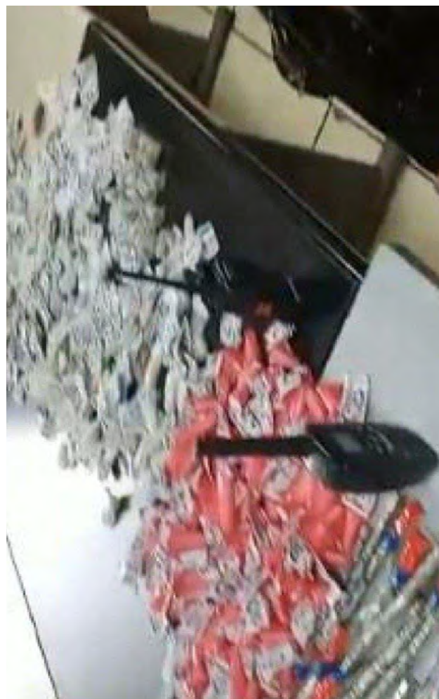
Poliçada fez grande apreensão de drogas

A ocorrência foi encaminhada para a 53ª DP, onde somente dois criminosos permaneceram presos.