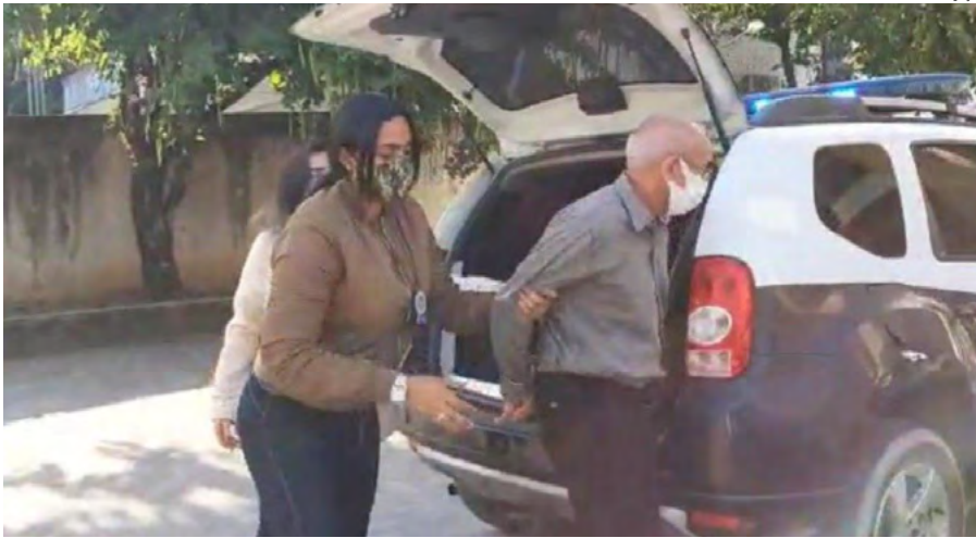
Meninas super poderosas prendem acusado de estupro

O suspeito é parente da vítima e não possui antecedentes criminais. Contra ele havia uma ordem de prisão preventiva expedida pela Comarca Criminal de Guapimirim. A captura foi feita com base no artigo 217-A do Código Penal (Lei nº 2.848/1940), que trata de crime de abuso sexual de vulnerável, ou seja, contra menores de 14 anos. A pena pode variar de 8 a 15 anos de reclusão. A prisão