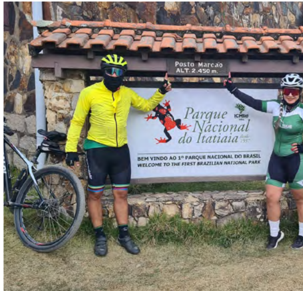
Pedala Paracambi esteve em Itatiaia

Segundo pesquisas, em Paracambi 70% dos moradores usam diariamente a bicicleta como meio de transporte. A prática do ciclismo tem se popularizado entre os paracambienses e traz inúmeros benefícios para a saúde, como melhoria cardiovascular, prevenção a problemas psíquicos, sociabilidade, entre outros. Porém, a cidade não tem uma área que seja dedicada à prática desportiva, como